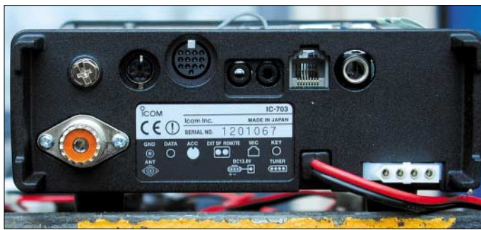
Bild 5: Rückseite des IC-703; die Bedeutung der einzelnen Buchsen lässt sich dem Typenschild entnehmen.

Einziger, ganz kleiner Wermutstropfen: Bei völlig ruhigem Band, z.B. ganz früh am Tag, kann man unter Umständen auf ein Phantomsignal hereinfliegen, das die vielleicht etwas zu geringe Seitenbandunterdrückung hervorruft. Telegrafie-Signale stärker S9 sind ganz leise unterhalb von Zerobeat ein zweites Mal zu hören. Aller-