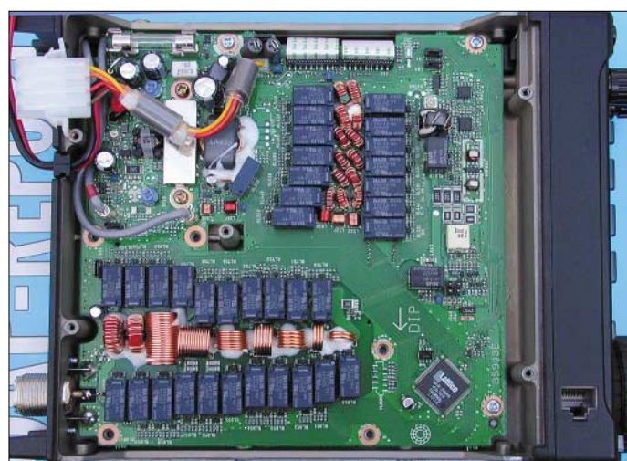
Bild 4: Die HF-Platine auf der Geräteunterseite wird von den beiden, mit Relais umgeschalteten Spulensätzen für Eingangsfilter (mitte) und Antennentuner dominiert.

passgerät rein, vorausgesetzt, es funktioniert. Bei meinen Test-QSOs habe ich das eingebaute Antennenanpassgerät mit mehreren verschiedenen Antennen ausprobiert, und alle ließen sich in Sekunden prima anpassen.