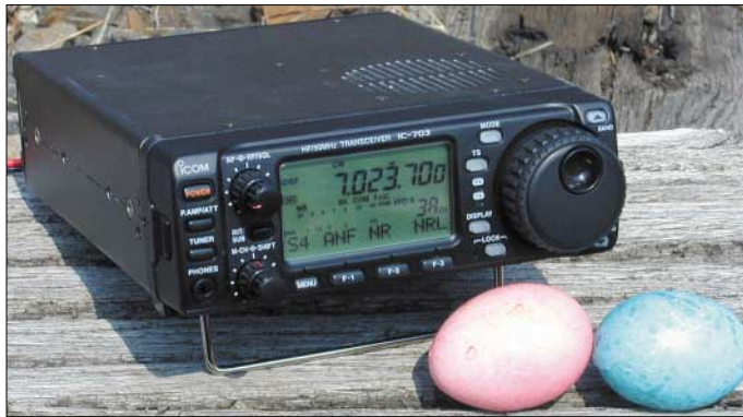
Bild 1: Als eine nette Osterüberraschung entpuppt sich Icoms neuer QRP-Transceiver IC-703

Seit im letzten Jahr die Internet-Adresse bekannt geworden war, auf der man ein erstes Foto von Icoms neuem QRP-Transceiver sehen konnte, verging kaum ein Monat, in dem nicht die Gerüchteküche zum Thema IC-703 hoch kochte. Besonders die eingefleischten Icom-Fans unter den QRPern begannen zu bohren und zu forschen, aber außer, dass das Gerät rein äußerlich sehr stark dem bekannten Mobiltransceiver IC-706 ähnelt, war nichts herauszubekommen.