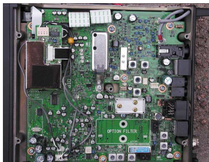
Bild 3: Dank SMD wirkt die ZF-/NF-Platine auf der Geräteoberseite relativ „leer“.

Überhaupt hört sich der Empfänger sehr gut an. Das Ganze ohne Abschwächer, den ich in den Tagen des Tests überhaupt nur