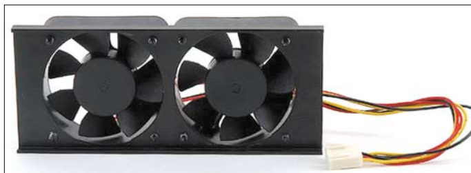
Schwer verzichtbares Zubehör bei der Nutzung mit lang dauern dem Oberstrichbetrieb wie SSTV, RTTY oder FM: der auf den Kühlkörper aufschraubbare Doppellüfter, Modell 308. Der Stecker ist innen im Gerät aufzustecken.

hörerbuchse. Der stabile Zink-Druckguss-Abstimmknopf mit Schwungradeneffekt macht dabei einen akkuraten Eindruck, wenn er auch im Neuzustand noch etwas schwergängig erschien.