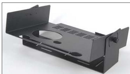
Die optionale Mobilhalterung, Modell 309, für den Argonaut V

Die RIT eignet sich mit ihren etwa 360 Hz/Umdrehung nur zum Ausgleich geringer Ablagen der Gegenstation; damit Split-Betrieb improvisieren zu wollen, endet in Frust, aber es gibt ja den zweiten VFO für Split- und Relaisbetrieb auf 10 m.