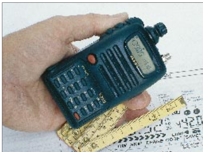
Technische Innovation, komprimiert auf kleinstem Raum: FT-50R von Yaesu. Doch alles bleibt bedienbar. Das LC-Display ist trotz der geringen Geräteabmessungen relativ groß ausgefallen, wovon besonders die Frequenzanzeige und die pfeilförmigen Segmente der Anzeige für relative Feldstärke und Sendeleistung profitieren. Für das Ablesen der Statusanzeigen – vor allem bei schlechter Beleuchtung – könnte eine Lesebrille nötig werden.

Bei eingeschalteter Sendestromsparfunktion reduziert das Gerät anhand der Empfangsfeldstärke die Sendeleistung auf einen